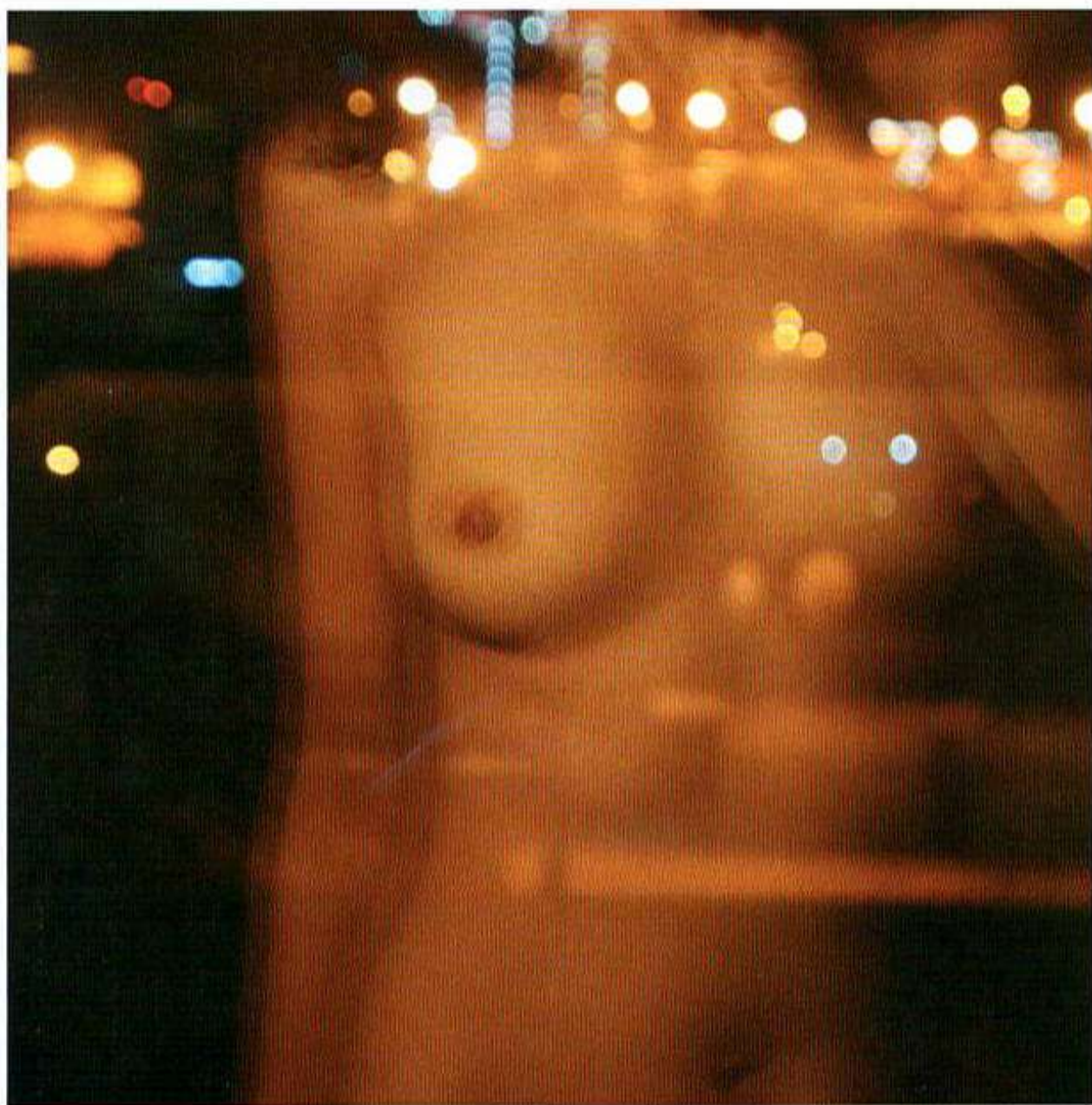
Autoportrait à Beyrouth (2020).